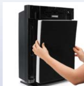
A szűrőbetétek behelyezése