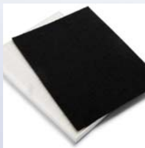
Széniszűrő és HEPA 14-szűrő