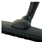
AeroPro™ Silent szívófej