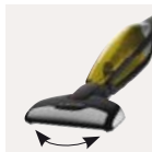
Könnyű manőverezés – sokoldalú szívófej