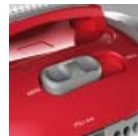
Ergonomikus megoldások, könnyű kezelhetőség