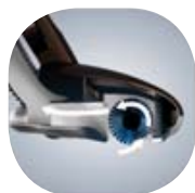
Forgókefés szívófej a finom por és a nagyobb törmeléknek hatékony takarításához