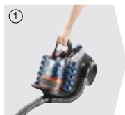
① Compact&Go megoldás...

A port már a tartályban összetömörítheti, így amikor kiönti a szemetesbe, nem kerül vissza a levegőbe.