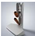
Kiegészítő/ tartozékok az állványon