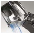
XL-es méretű portartály