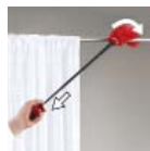
Nehezen elérhető helyekhez