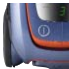
Lágy burkolatú kerekék