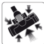
Kiváló tisztítási hatékonyság

Az UltraOne-t úgy terveztük meg, hogy a porszívózás a lehető legkönnyebb és legegyszerűbb legyen. Egyszerűen lehet vele manőverezni, ugyanis nagy hátsó kerekével és a 360 fokban forgó első kerekével simán átgurul a kűszöbökön, és könnyedén kerül ki a bútorokat. A vezérlőgombokat – a kábelcsévélet és a be/kikapcsoló gombot – lábbal is lehet működtetni. Az új UltraOne 1 kióval könnyebb, ezért kényelmesebb lesz fel- vagy levinni a lépcsőn, a plusz parkolóklipsz pedig még kényelmesebbé teszi a tárolást. Még egyszerűbben cserélhető a porzsák, és a szűrőcsere is sokkal kényelmesebb az új modelleknél. A szűrő tetejét elég egyszer megnyomni, az máris kinyílik és kiemelhető az elhasznált szűrő. 12 m hosszú kábelét nem kell folyton átdugni másik konnektorba, a hatékony HEPA 13 szűrőnek köszönhetően pedig tisztább és egészségesebb is lesz otthona.