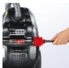
Tollseprű a helyén