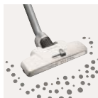
Dust Magnet szívófej, előlről és oldalról is szívja a port