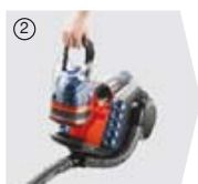
② ...a portartály tisztább...