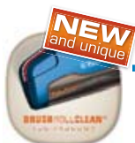
BRUSH ROLL CLEAN TECHNOLÓGIA

Maga a megtestesült design. És mindig kéznél van.