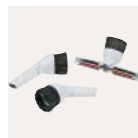
3 funkciós tartozék