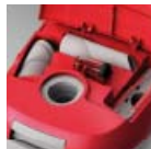
3 beépített tartozék