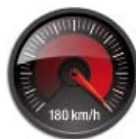
Szuper gyors porfelszedés