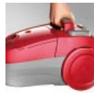
Kompakt és könnyű