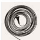
Hosszabb kábelével bármедг elér

Kis helyen is elfér, és 13 méteres hatótávolságával bárhová elér.