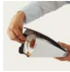
Gyors szűrőtisztítás a kihúzható rekesz segítségével