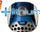
ErgoRapido® 2in1 Plus – 18 V-os lítium-ion akkumulátorral