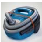
Ergoshock – a cső egyszerű tárolásához