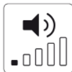
A legcsendesebb Silent Air Technology™