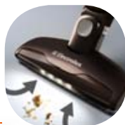
Beépített világítás – semmi sem marad észrevétlen