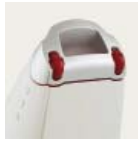
Kerekek, melyek megóvják a felületet a sérülésektől

A Rapido a világ első, görgőkkel is felszerelt morszapszivója, amellyel gyors és könnyű a takarítás. Kevesebb fárasztó a kezünk számára, hiszen a porszívó könnyedén siklik bármilyen felületen anélkül, hogy sérülést okozna a bútoron vagy becsipné a terítőt. Vezeték nélküli és feltölthető akkumulátorral működik, egyszerűen az otthonába, autójába, hajón vagy táborban egyaránt.