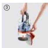
③ ...és egyszerűbb ürítéséhez.