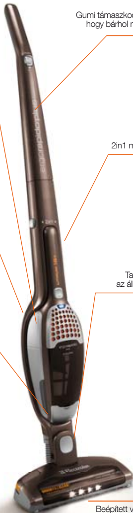
Gumi támaszkodófelület, hogy bárhol megálljon