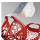
Porzsáktartó kosár: egyszerű porzsákcseré