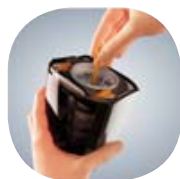
Gyorsan tisztítható szűrő

A kényesebb felületeket, például az asztalt, a bútorokat vagy az autóbelsőjét is ki lehet vele takarítani – csak emelje ki a morzsaporszívó egységet, és máris kezdheti a takarítást.