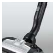
AeroPro™ Silent szívófej