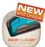
BRUSH ROLL CLEAN TECHNOLÓGIA